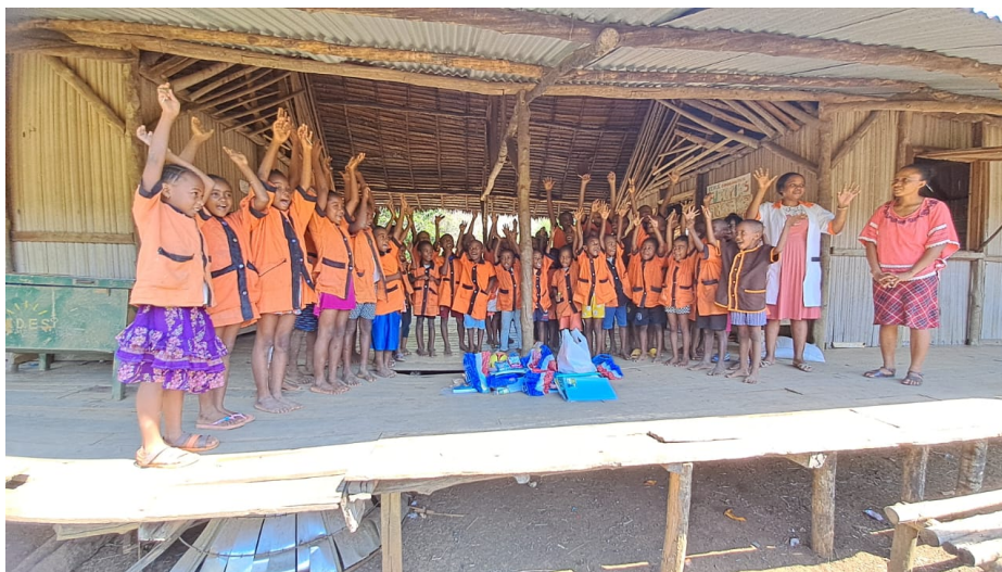
Photo de groupe novembre 2023 – Remerciements suite à des dons (cahiers, stylos...)

Nous voyons que dans les moments où nous communiquons nous avons plus de dons via Paypal, par exemple.